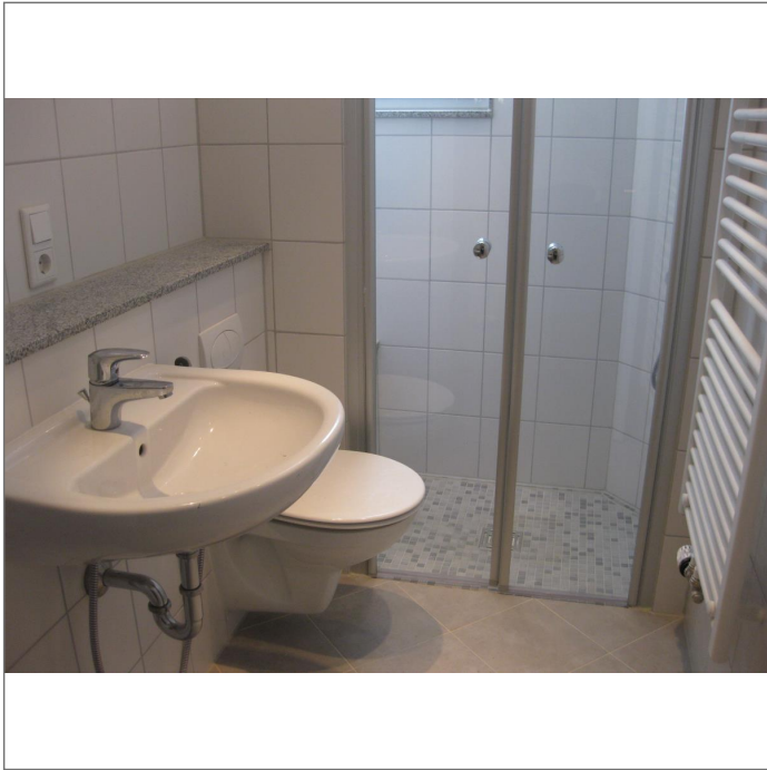
- Das Bad